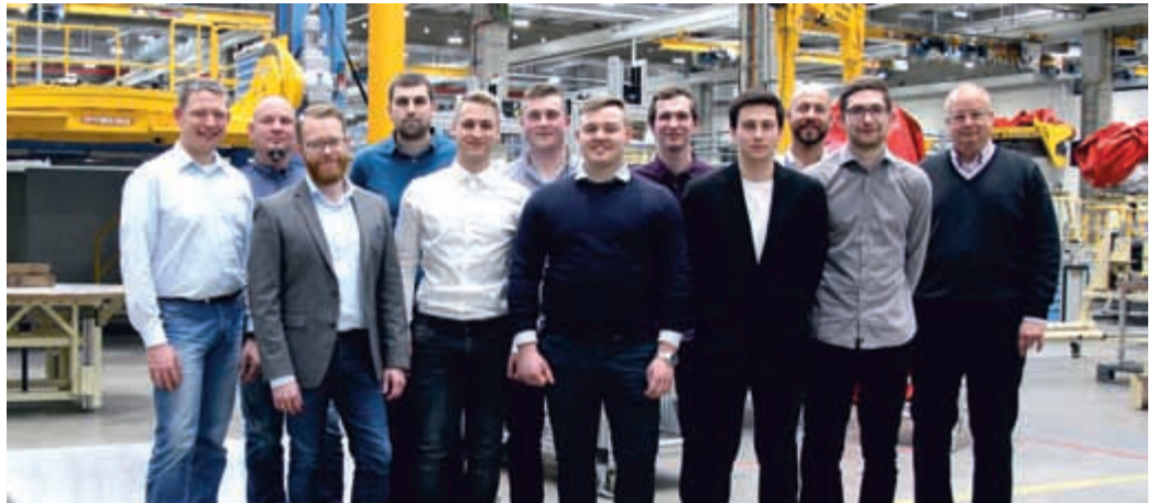
Die Absolventen der technischen Berufsausbildung mit ihren Ausbildern, dem Personalleiter, den Bereichsleitern der Teams, in denen die jungen Kollegen arbeiten werden, sowie dem Betriebsrat von N3 Engine Overhaul Services.

Nach dreieinhalb Jahren Ausbildung zum Fluggerätmechaniker, Fachrichtung Triebwerkstechnik, erhielten am 1. Februar 2019 sieben junge Männer ihren Arbeitsvertrag bei N3 Engine Overhaul Services in Arnstadt. Der Instandhaltungsbetrieb für Rolls-Royce Flugzeugmotoren bildet aktuell in zwei Berufen aus: Fluggerätmechaniker seit 2008 und seit 2016 Fachkräfte für Lagerlogistik. Für die Ausbildungsjahrgänge 2019 gibt es noch offene Plätze.