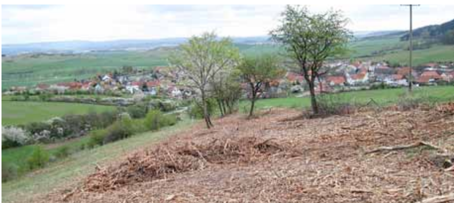
Zerstörung einer Hecke

Bäume sind lebende Organismen. Sie bestehen aus Wurzel, Stamm und Krone, die sich gegenseitig versorgen. Gesunde Bäume befinden sich in einem Versorgungsgleichgewicht. Starke Eingriffe in die Krone wirken sich meist negativ auf die Wurzel aus. Besonders Kappungen führen in der Regel zu einer verkürzten Lebenszeit der so verstümmelten Bäume. Die Folge ist ein erhöhter Kontroll- und Pflegeaufwand, der wiederum mit erhöhten Kosten verbunden ist.